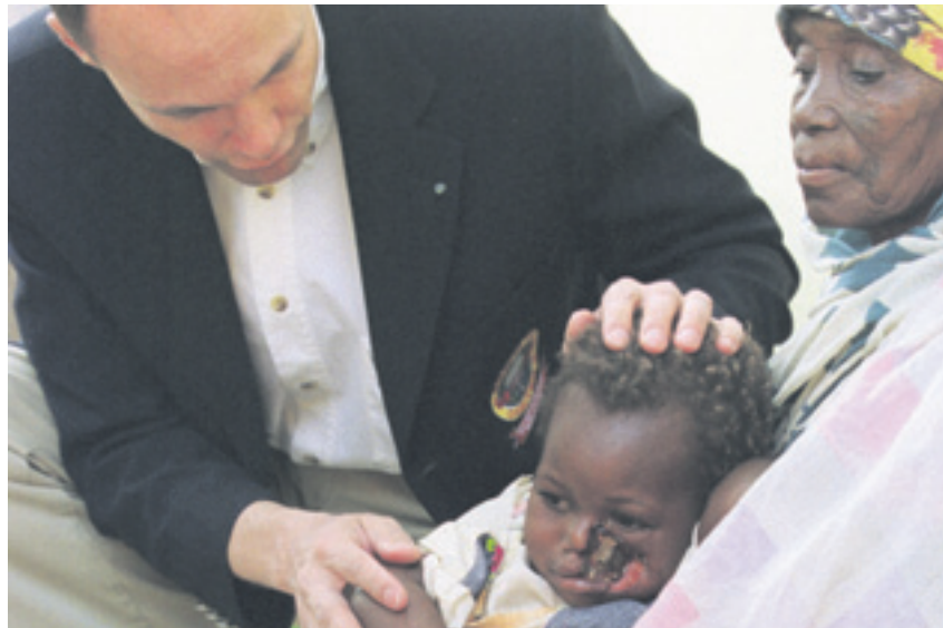
Bertrand Piccard mit einem Noma-Kind und dessen Mutter in Afrika: Der Heissluftballonfahrer ist am 28. November an der RJW-Benefizgala in Triesen zu Gast.

Tickets sind unter www.benefiz.li erhältlich. Weitere Informationen: www.benefiz.li , www.rjw.ch , www.windssofhope.org