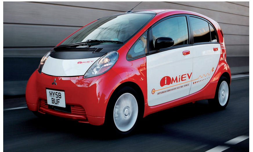
Der Mitsubishi i MiEV: ein adaptiertes, umweltfreundliches Elektrofahrzeug.

Region. – Mitsubishi Motors hat mit dem i MiEV auf Basis des in Japan beliebten Stadtautos «i» ein revolutionäres und umweltfreundliches Elektrofahrzeug zur Serienreife entwickelt.